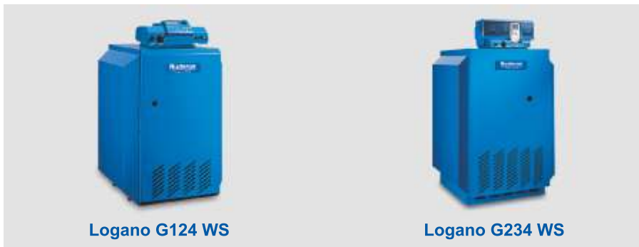
Logano G124 WS

Бесспорным преимуществом газовых отопительных котлов Logano G124 WS и G234 WS является возможность стабильной работы в газовых сетях с низким давлением, что весьма актуально для белорусского потребителя. Котлы данной мощности допускают эксплуатацию с подводимым давлением газа 10 мбар. При этом серии Logano G124 WS и G234 WS сохранили основные качества, присущие котлам Buderus: надежность, экономичность, компактность и отличный дизайн. Процесс горения в этих котлах происходит практически без образования сажи, поэтому объем работ по техническому обслуживанию и чистке данных моделей сводится к минимуму.